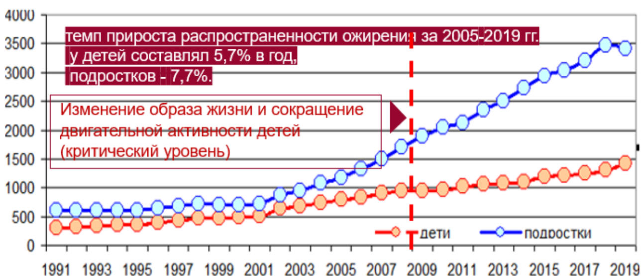
Рисунок - 2. Распространенность ожирения у детей и подростков по РФ в динамике за 1991-2019 гг. (на 100 тыс. нас.)

Анализ показателей, характеризующих здоровье детей убедительно свидетельствует о неуклонном росте числа лиц, страдающих от заболеваний, обусловленных нездоровым питанием (рис.2-3).